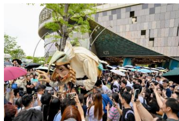
深圳K11 ECOAST引入法國知名戲劇於大灣區首次演出，在五一黃金周期間錄得日均人流接近15萬，創下今年新高。

廣州漢溪K11成為節日期間的熱門文化旅遊地點，在親子、藝術及文化系列活動帶動下，五一黃金周期間人流按月上升30%，自駕到訪的消費者按月增長近57%；整體銷售額按月增幅有63%，其中零售銷售額增幅達1.04倍。