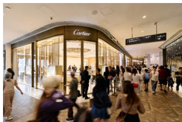
受惠于品牌升级计划越见成效，K11 MUSEA于五一黄金周首四日中，旅客消费额按年增1.25倍。

集团于香港的零售业务表现同样亮眼，K11 Art Mall出租率长期维持100%，K11 MUSEA出租率接近98%。K11 MUSEA内有不少国际奢侈品牌都在五一黄金周前夕完成迁址升级，并重新亮相，包括Balenciaga的全港首间复式双层专门店、Delvaux的全新旗舰店及Tory Burch的全港最大精品店等，另有知名香氛品牌SHIRO等高端生活方式品牌。下半年新进驻品牌有Prada及Miu Miu等，将有效刺激整体访客的消费意欲。