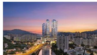
「THE PAVILIA FARM 柏傲庄」销情炽热，截至今年5月31日，「柏傲庄」系列现楼发售累计367伙，合约销售金额逾59亿港元。

新世界发展与港铁公司合作发展、位于大围站上盖的临河地标式大型住宅项目「THE PAVILIA FARM 柏傲庄」销情炽热。上月招标出售的单位中，「柏傲庄I」一个实用面积1,363平方呎、四房双套连960平方呎天台，享开扬城门河景的高层B室单位，连同两个车位，以成交价逾5,600万港元及每呎41,086港元，创下项目自现楼销售以来的成交价及呎价新高。截至今年5月31日，「柏傲庄」系列现楼发售累计367伙，合约销售金额逾59亿港元。