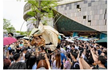
深圳K11 ECOAST引入法国知名戏剧于大湾区首次演出，在五一黄金周期间录得日均人流接近15万，创下今年新高。

广州汉溪K11成为节日期间的热门文化旅游地点，在亲子、艺术及文化系列活动带动下，五一黄金周期间人流按月上升30%，自驾到访的消费者按月增长近57%；整体销售额按月增幅有63%，其中零售销售额增幅达1.04倍。